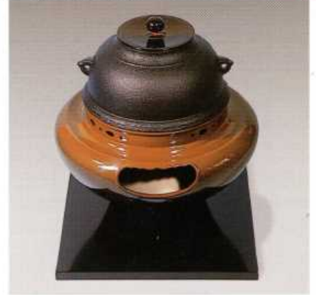
F402 合金製 朝鮮風炉(古銅色)

径:30cm・高さ:33.5cm 100V/400W 灰型付 〈付属品一式〉志きの釜・釜かん まえかわらけ 真塗敷板 切替中間スイッチ付(200W・200W・400W)