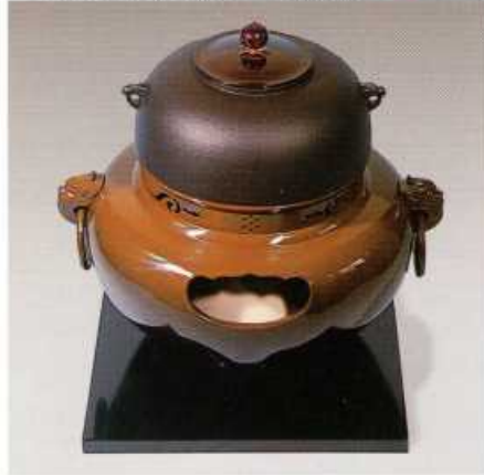
F401 合金製 鬼面風炉(古銅色)

※付属品の有無の記号 ーは香入付 ㊦はコード付、風炉には付属品として敷板・まえかわらけ付。一部の風炉は