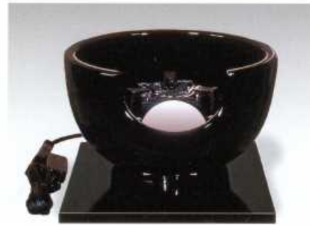
F406 真塗(紅鉢型) お炭点前 使用可能 径:30cm・高さ19cm 100V/400W

径:29cm・高さ:31cm 100V/400W 灰型付 〈付属品一式〉志きの釜・釜かん まえかわらけ 真塗敷板 切替中間スイッチ付(200W・200W・400W)