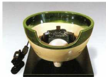
F411 織部(紅鉢型) お炭点前 使用可能 径:30.5cm・高さ:18.5cm 100V/400W (荒木俊碩 作)