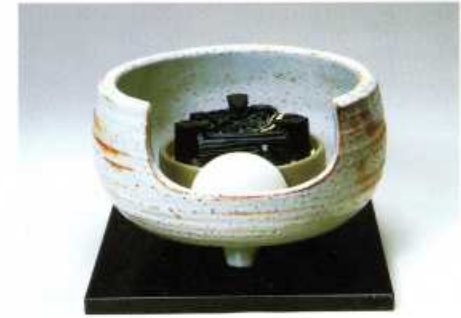
F407 志野(道安型) 径:30cm・高さ:19.5cm 100V/400W (荒木俊碩 作)