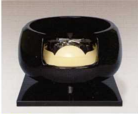
F423 真塗道安(小) (面取り)

径:31cm・高さ:18cm 100V/400W 〈付属品一式〉真塗敷板 まえかわらけ 灰型付 切替中間スイッチ付(200W・200W・400W)