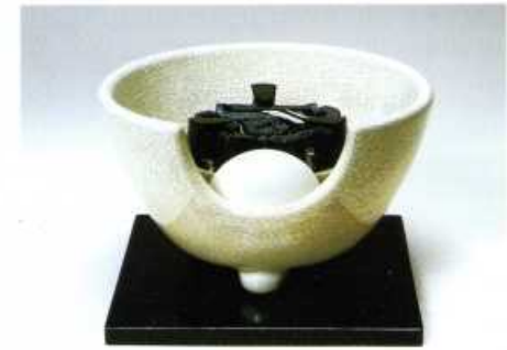
F412 白さつま(紅鉢型) 径:28.5cm・高さ:18cm 100V/400W

※陶製の風炉は多少の変形があります。 又、カタログの色と多少異なる事が ありますので、ご了承ください。