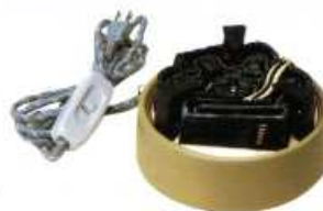
F415 風炉用炭型ヒーター 径:16.5cm・高さ:9.5cm 100V/400W (径15cmにもなります)

発明協会奨励賞受賞 科学技術庁長官奨励賞受賞 現代茶道の革命 実用新案・意匠登録・通産省型式認可済