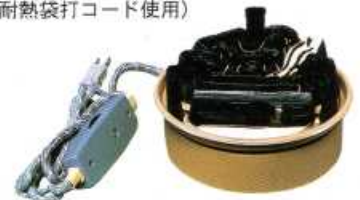
F416 風炉用炭型ヒーター 径:18cm・高さ:11cm 100V/500W 切替中間スイッチ付(200W・300W・500W) (耐熱袋打コード使用)